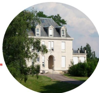
Château « Le Clos » Route d'Affracourt Tantonville